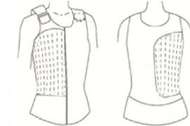
1/2 Vulling verticaal