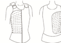
1/2 Vulling horizontaal