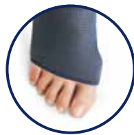
Hallux valgus open teen