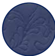
Tailleband met bloemmotief (5 cm)