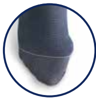
Hallux valgus gesloten teen